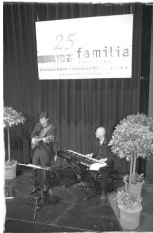
Die Musik „Swing – Time“